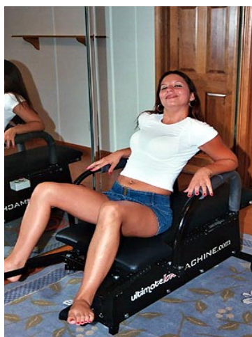
Máquina del amor.