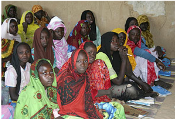
Un grupo de mujeres africanas atiende una charla sobre prevención del VIH

A pesar de la gran variedad genética y de la complejidad que muestra el VIH en las personas que son seropositivas desde hace tiempo, cuando éstas lo transmiten a sus parejas por vía heterosexual, la nueva infección suele comenzar sólo por una variante sencilla del virus. Esto es así porque la mucosa genital, cuando está intacta, forma una especie de "cuello de botella genético" que impide el paso de múltiples variantes (aunque deja pasar alguna). Sin embargo, investigadores de EEUU y África acaban de comprobar que la presencia de una enfermedad de transmisión sexual (ETS) agranda este "cuello de botella" y hace que los individuos sean más susceptibles al VIH y a infectarse con más de una variante.