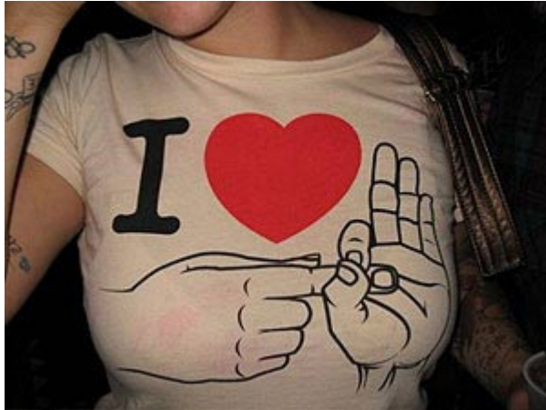
Como se ha hecho toda la vida

Aunque este artículo sea el último hasta el mes de septiembre, no es mi intención dar a entender que estoy encomendando una tarea extraescolar veraniega, como los libros de ejercicios para el periodo vacacional de los niños. Ni mucho menos. Aunque agosto es un mes que se hace muy largo, cada uno mata el tiempo como quiere. Sin embargo, si a alguno le pica la curiosidad, que sepa que ciertos lubricantes y juguetes sexuales pueden ser la mejor manera de combatir la monotonía del ferragosto, como dicen los italianos, indagando aspectos ocultos, ignotos y olvidados de nuestra anatomía.