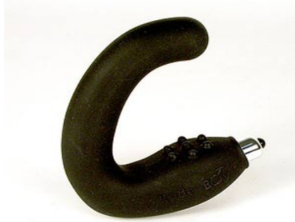
Estimulador del punto G masculino

No era el lugar ni el momento, ni posiblemente el interlocutor más adecuado, para hacer una encendida defensa de las posibilidades sexuales del esfínter anal, desde luego. Y mucho menos intentar hacerle entender que una prueba médica tiene lo mismo que ver con el sexo anal que la matanza del cerdo con el mostrador de una charcutería.