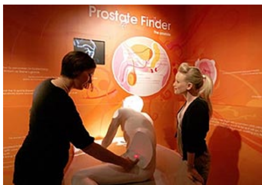
Buscando el punto G masculino.

Londres es un rollo. Las dos veces que he visitado la capital inglesa me ha parecido el sitio más antipático, gris y borde en el que he puesto los pies. La primera vez fue todo un impacto: llegué un viernes por la tarde y toda la ciudad (y cuando digo toda, es toda) estaba borracha. La famosa 'happy hour'. Gritos, vomitonas, viejecitas haciendo esos paseando al perro, ejecutivos peleándose y rodando por el suelo... Vamos, como algunas calles de Benidorm o de Playa de Aro, pero nublado y con casas más destartaladas.