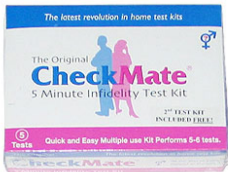
Detecta semen en 5 minutos. www.semenprobe.com