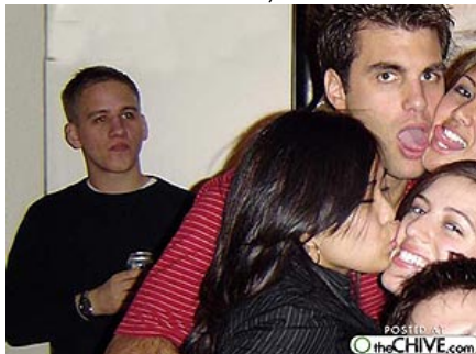
Índices de Pulsión Sexual dispares.

En septiembre conoceremos los resultados del test de este año. Por lo pronto, yo lo he hecho y puedo afirmar que algunas preguntas descolocan un poco. "¿Has probado la postura del ornitorrinco?" o "¿Con qué vocal jadeas?" son mis favoritas, aunque, por supuesto, también podemos encontrar cuestiones menos inesperadas como "¿De qué equipo de fútbol eres seguidor?" o "¿A qué edad empezaste a masturbarte?". Vamos, lo normal.