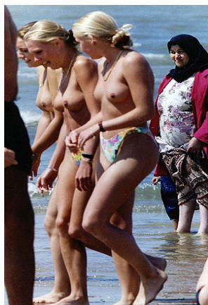
Diferencias culturales, dicen.

Si la medida propuesta es excesiva, quizás bastaría con recomendarles echarle un vistazo a qué opina la OMS de la salud sexual y su importancia en el bienestar de las personas a todos los niveles (física y psicológicamente). Y mira que la Organización Mundial de la Salud no es una entidad que promueva orgías y bacanales, precisamente. Pero bueno. En última instancia conviene recordar que Rumanía forma parte de esa cosa que se llama Unión Europea y que se supone que nos hace a todos iguales y súper chachi-piruli. Por suerte cada Estado puede mantener su propia idiosincrasia, aunque huelga a rancio.