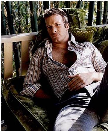
El protagonista de 'Hung'.

Tras abandonar a su mujer, quemarse la casa y tener que apañarse con sus hijos (uno de ellos gótico) viviendo en una tienda de campaña, el protagonista comienza una provechosa carrera como gigoló [ www.youtube.com/watch?v=apWDz5u2PW8 ]. ¿Os imagináis un argumento así en una serie española? Ya, difícil tirando a imposible, sobre todo sin caer en una parodia burda de las películas españolas del destape. Por lo tanto, vamos a ponerle una velita a quien corresponda para esperar que algún día podamos ver esta serie en nuestro país. Aunque sea a horas intempestivas y cambiando de día de emisión sin previo aviso, que para eso somos cuatro gatos. Eso, o cometer un delito cultural y descargársela de internet, como hacen algunos. Yo no.