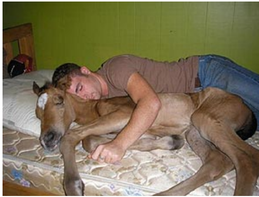
La siesta y los documentales de animalitos.

Empecemos por la mañana. Recién despertados no es un momento muy oportuno para tener sexo. El organismo femenino no está demasiado predispuesto. Parece ser que el nivel de melatonina (la hormona del sueño) es muy alto y la temperatura corporal es baja. Por el contrario, el hombre tiene en las primeras horas del día las hormonas sexuales bastante disparadas. Entre las 8 y las 10 de la mañana las endorfinas alcanzan su nivel máximo en las mujeres. En los hombres, alrededor de las 9, las hormonas sexuales se encuentran a un nivel 50% más elevado que el resto del día. Hete aquí el secreto de lo sensacional y placentero que pueden resultar muchos coitos mañaneros (sobre todo, en domingo, claro).