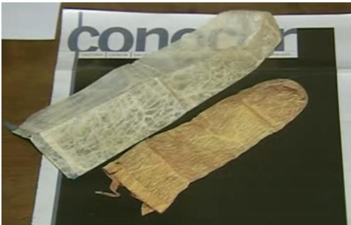
Los ejemplares en cuestión...

Los profilácticos datan de las primeras civilizaciones egipcias y parece que los fabricaban con tripa de cerdo o cordero. Como eran medio ásperos primero se los remojaba en leche y luego, una vez usados, se desinfectaban con agua tibia y se llenaban de talco o fécula de papa hasta la próxima cita. En una punta iban cosidos y en el otro extremo tenían un piolín para que el caballero pudiera ajustarlo.