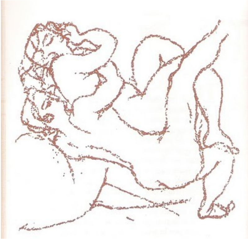
Grabados de Marco Antonio Raimondi a partir de las ilustraciones de los sonetos lujuriosos de Giulio Romano

Bien sería tener pocos cojones, que viéndome ganas de tu culo obrase con tan necio disimulo que escuchase lamentos o razones. Húndase de mi alcurnia los blasones si por el culo no te atizo estopa. ¡Niña! Quítate allá toda esa ropa; afuera la camisa y los pantalones. - Aquí me tienes; tómame y disfruta como quieras que todo te lo entrego; si tú eres buen cabrón, yo buena puta. Que por delante y por detrás me abraso, y lo que quiero es me prendas fuego y que al punto me saques de este paso. Sobre que ya sería gran bobada hacerlo como Adán. Y yo, en tu puesto, ten por cierto que el culo te rajaba.