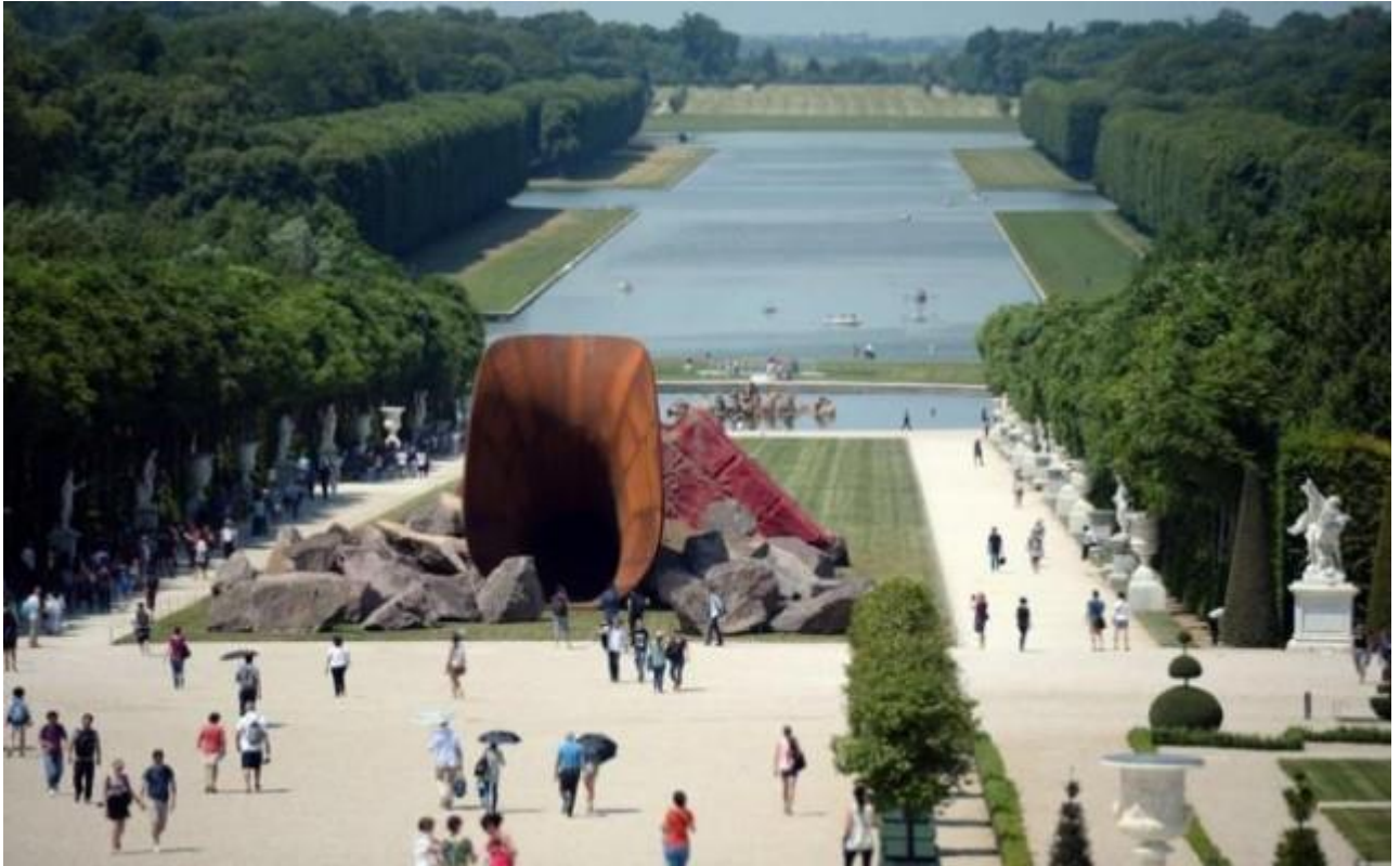
La intimidad de la reina

recuérdese los enredos de alcoba de los últimos dos presidentes), los políticos conservadores consideran la instalación como un ultraje a la historia del país, sobre todo desde que Kapoor confesó en una entrevista que quiso representar “la vagina de la reina tomando el poder.”